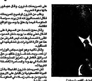
الرئيس شارون في زيارة الى القدس (ديارنا)

أعلن شارون طلب من المستوطنين الاستيلاء على مزيد من الأراضي. وأضاف أن شارون طلب من المستوطنين الاستيلاء على مزيد من الأراضي. وأضاف أن شارون طلب من المستوطنين الاستيلاء على مزيد من الأراضي. وأضاف أن شارون طلب من المستوطنين الاستيلاء على مزيد من الأراضي.